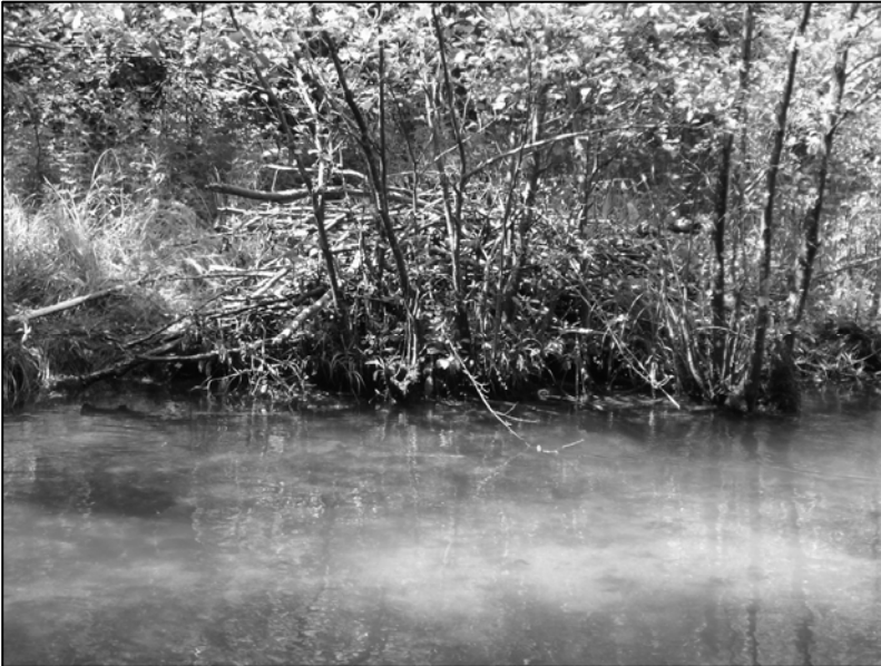
Slika 4. jedna od brojnih izgrađenih dabrovih humki u Semešnici; Photo 4. one of numerous beaver castles in Semešnica; Orig. 2005.