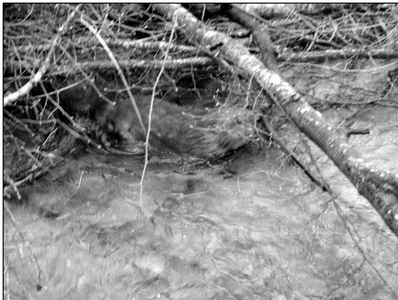
Slika 3. Prvi dabar u slobodnoj prirodi u BiH nakon više od 100 godina; Photo 3. First beaver in nature in BiH, after more of 100 years; Orig. 2005.

Četinare jedu rijetko ili samu u izuzetnim slučajevima. Ishrana obuhvata pojas od oko 10 metara od obale i dabrovi se inače rijetko kreću na udaljenosti većoj od 50 metara od vode. Preferiraju drveće sa prečnikom manjim od 10 cm, ali mogu da obore i stabla sa prečnikom do jednog metra. U područjima sa oštrim zimama, dabrovi prenose drvenasti materijal do jazbine i zabadaju ga u dno vodenog toka, tako da ga mogu jesti kada se voda zamrzne (4). Kao i kod ostalih glodara, sjekutići im konstantno rastu tokom života i moraju se stalno koristiti da ne bi postali predugi, odnosno da bi se spriječilo prorastanje. Zbog ovog razloga, dabrovi ponekad glođu stabla bez toga da ih obaraju i koriste.