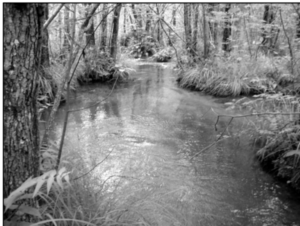
Slika 1. Motiv sa rijeke Semešnice; Photo 1. Motive from Semešnica River; Orig. 2005.

Kao prvi lokalitet za ponovno naseljavanje dabra odabrana je rijeka Semešnica kod Donjeg Vakufa. Analizom užeg područja Semešnice, koja ima dužinu toka od 18 kilometara, te vegetacijskog sastava, klimatskih prilika i kolebanja nivoa vode, zaključili smo da je odabrani lokalitet više nego pogodan za ponovno naseljavanje. U prilog prirodnim karakteristikama idu i odsustvo naselja, povremen i kontrolisan saobraćaj.