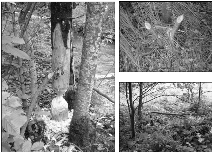
Slike 5,6 i 7. Tragovi aktivnosti dabrova duž korita Semešnice; Photos 5,6 and 7. Signs of beaver acitivity within Semešnica flow; Orig. 2005.

Sa ovog aspekta, ukoliko ne bude drastičnijih gubitaka u unesenoj populaciji tokom zime i usljed predacije, moralo bi se razmisliti o izboru novih lokaliteta za dalje naseljavanje dabra u BiH. Mladi dabrovi, koji će doći na svijet u našim uslovima, svakako su mnogo pogodniji za dalje naseljavanje, da se ne govori o ekonomičnosti naseljavanja. U svijetu sisara dabrovi su poznati po svojim mogućnostima da mijenjaju okruženje i da ga učine odgovarajućim za sebe, uglavnom izgradnjom brana, kanala, itd. Ove aktivnosti determinišu mnoge veze koje dabrovi imaju sa florom i faunom na mjestima gdje obitavaju.